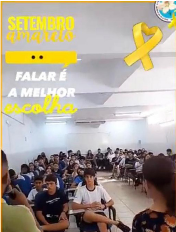
Alunos participando da palestra

Pensando assim, trouxemos 3 representantes do CAPS de Três Pontas que falaram sobre os transtornos psíquicos, autoestima, a importância de se cuidar e se amar enquanto ser único e especial. Foi um momento muito emocionante e importante para todos nós.